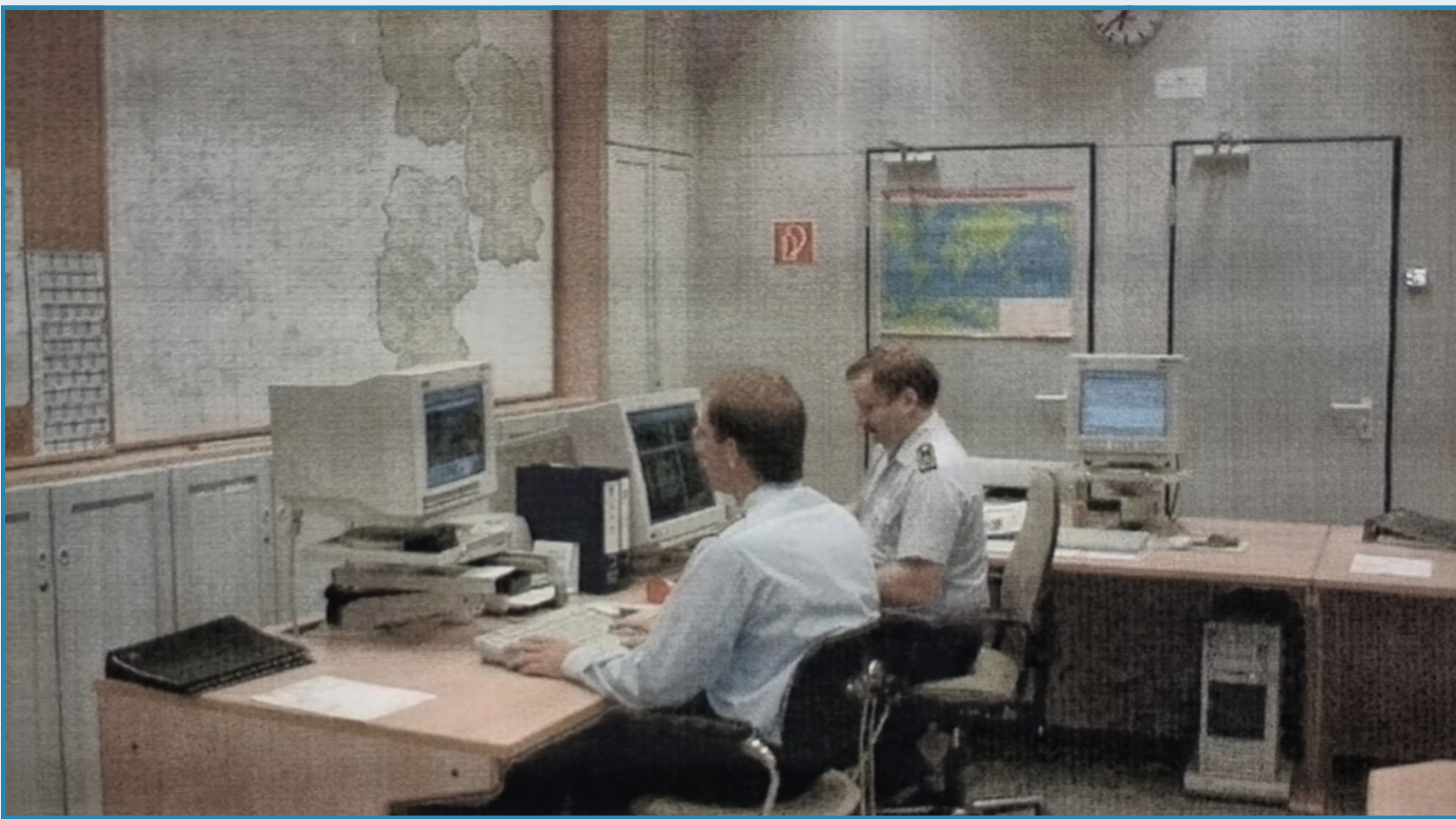
Automatisches Führungs-Fernmeldenetz der Luftwaffe (AutoFüFmNLw)

Fernmeldeverbindungsdienst der Luftwaffe Hauptauftrag: IT-Versorgung der Luftwaffe