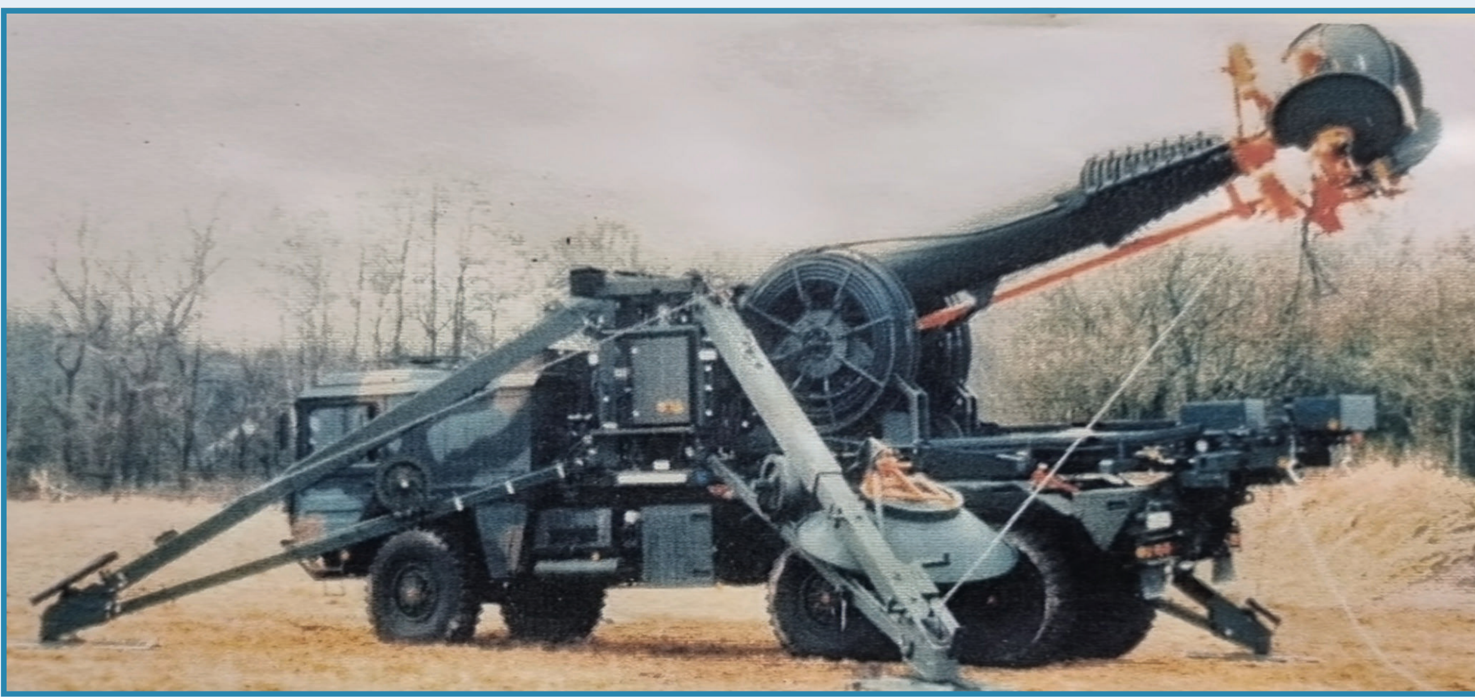
Antennenmastanlage AMA 34 – Antennenhöhe: 10 – 34mAufbauzeit: 20 Min.(seit 1994 im Einsatz)