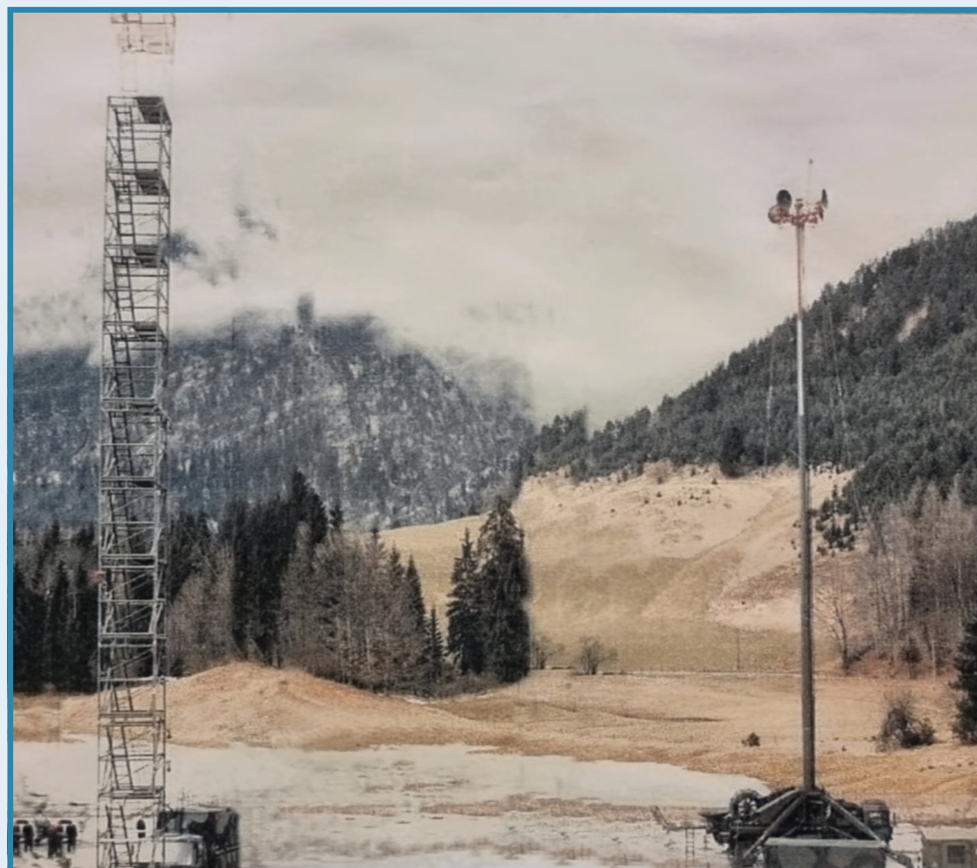
Antennenmast AT 10 / 45mAufbauzeit: 8 Std. (bis 1994 im Einsatz)