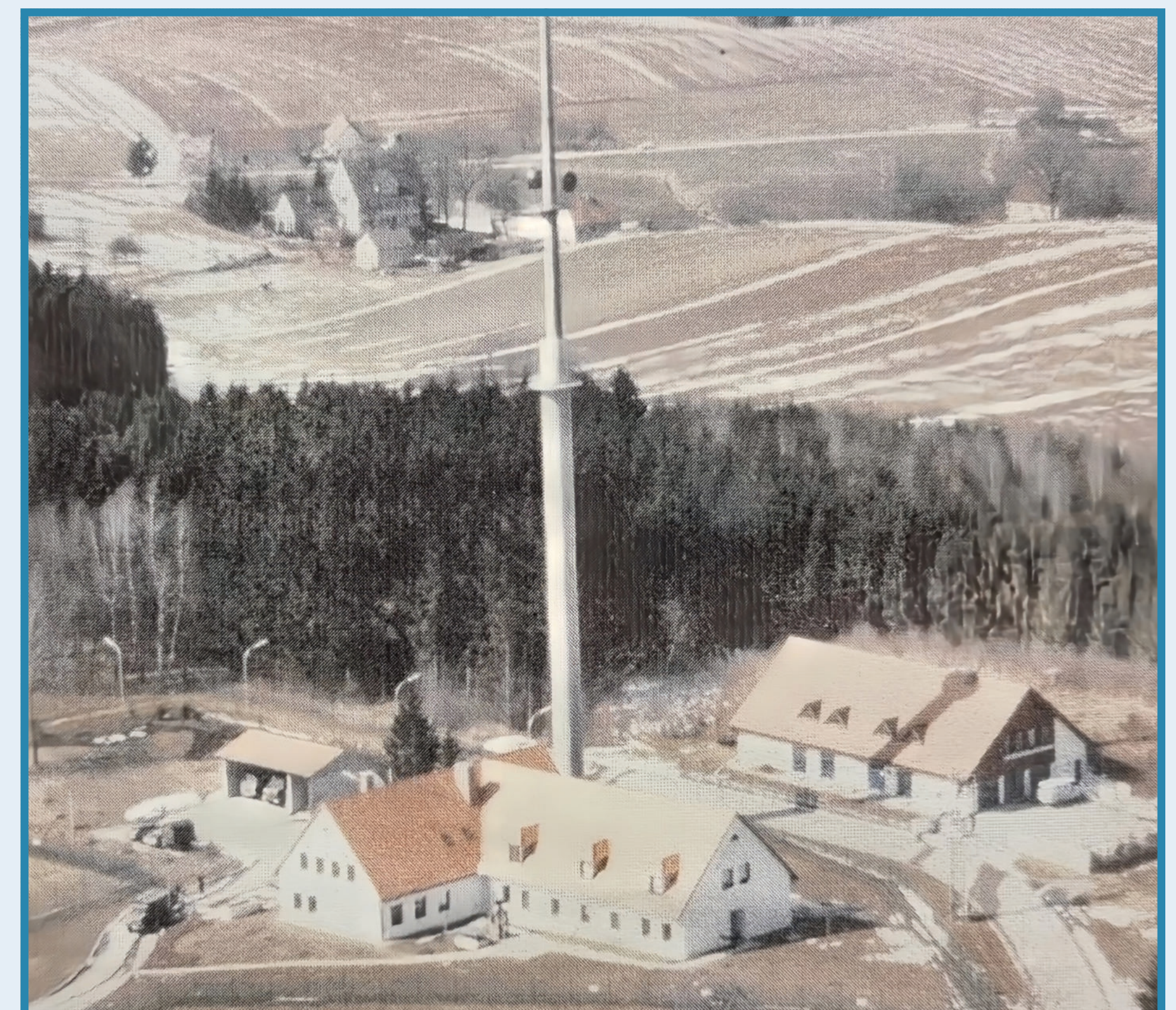
Ortsfeste Richtfunkstation mit modernem Schleuderbetonmast