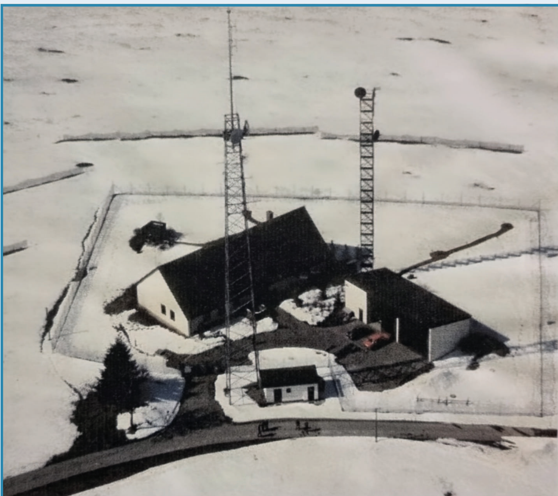
Ortsfeste Richtfunkstation mit stationärem Antennenturm und Antennenmast AT