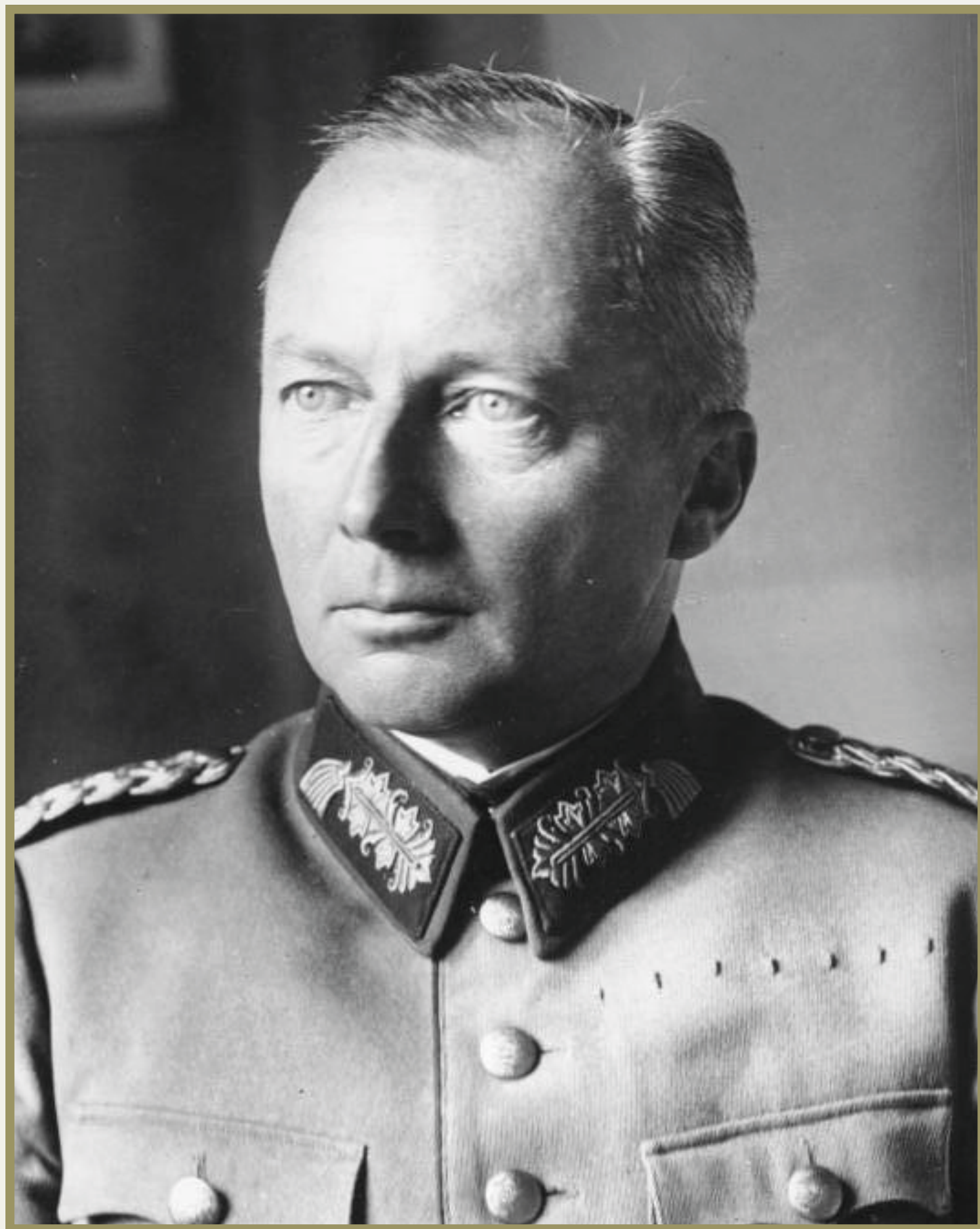
Generalmajor Günther von Kluge 01.10.1933 – 01.10.1934 Inspekteur der Nachrichtentruppe

Mit Beginn der dreißiger Jahre ergab sich für die Inspektion der Nachrichtentruppe eine Doppelaufgabe. Einerseits war die schnell fortschreitende Entwicklung der Nachrichtentechnik im Auge zu behalten und beim Wiederaufbau der Heeres-Nachrichtentruppe zu berücksichtigen und zum anderen mussten die Schlussfolgerungen aus der gewonnenen Erkenntnis durchgesetzt werden, dass die Führung des Weltkriegsheeres die verfügbaren Nachrichtenmittel nicht hinreichend genutzt hatte. Schließlich zeichnete der Inspekteur verantwortlich für die Ausrüstung und Ausbildung der Nachrichtentruppe und für den richtigen bzw. zweckmäßigen Einsatz ihrer technischen Nachrichtenmittel.