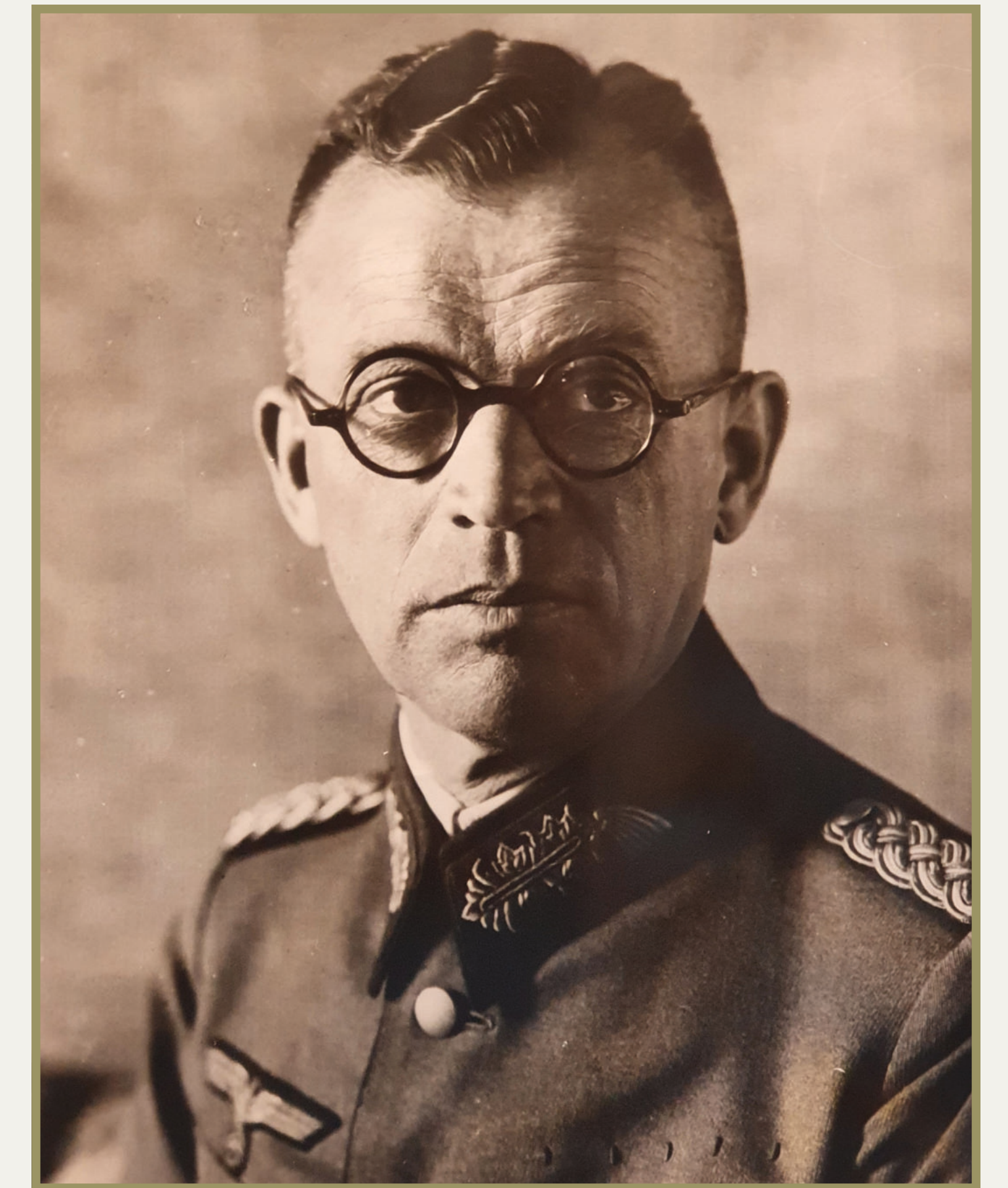
Generalmajor Erich Fellgiebel 01.10.1934 – 12.10.1937 Inspekteur der Nachrichtentruppe 12.10.1937 – 25.08.1939 Inspekteur der Nachrichtentruppe zgl. Inspekteur der Wehrmacht-Nachrichtenverbindungen

Bereits 1933, unmittelbar nach seiner Berufung zum Stabschef der Inspektion, hatte Fellgiebel begonnen, die Truppe neu zu konzipieren und die bis dahin lose Bindung zwischen dem militärischen und staatlichen Nachrichtenwesen zu festigen. Seiner Weitsicht entsprang die ab Mitte der dreißiger Jahre immer enger werdende Zusammenarbeit mit dem staatlichen Nachrichtenwesen sowohl auf der Führungsebene der Ministerien, als auch der Reichspostdirektionen.